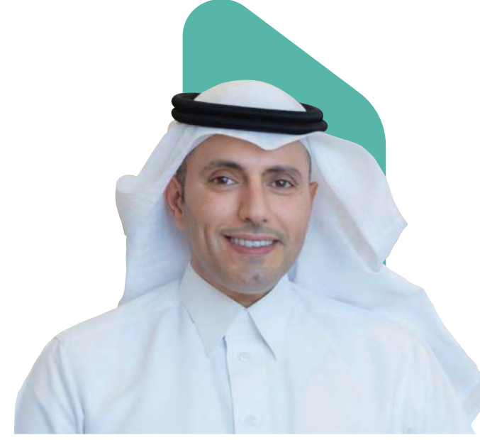
معالي د. عصام الوقيت مدير مركز المعلومات الوطني