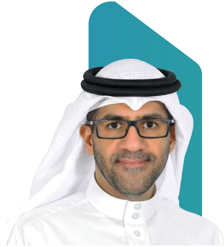
رئيس الهيئة العامة للإحصاء فهد بن عبدالله الدوسري