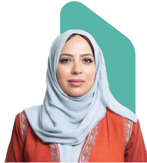
سعادة أ. انتصار الوهيبية مدير عام المركز الإحصائي الخليجي