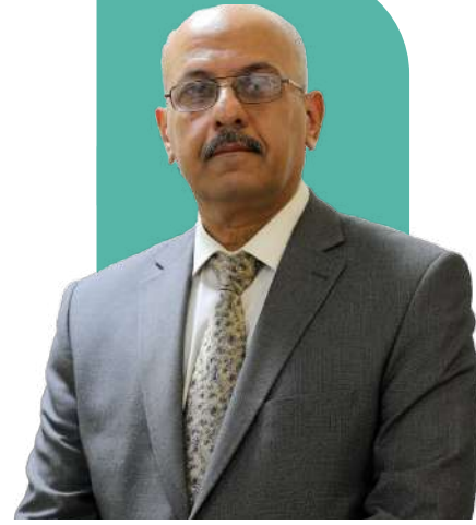
ضياء عواد كاظم

رئيس هيئة الإحصاء ونظم المعلومات الجغرافية في جمهورية العراق