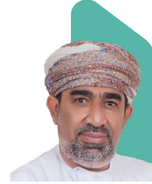
سعادة د. خليفة البرواني الرئيس التنفيذي للمركز الوطني للإحصاء والمعلومات في عمان