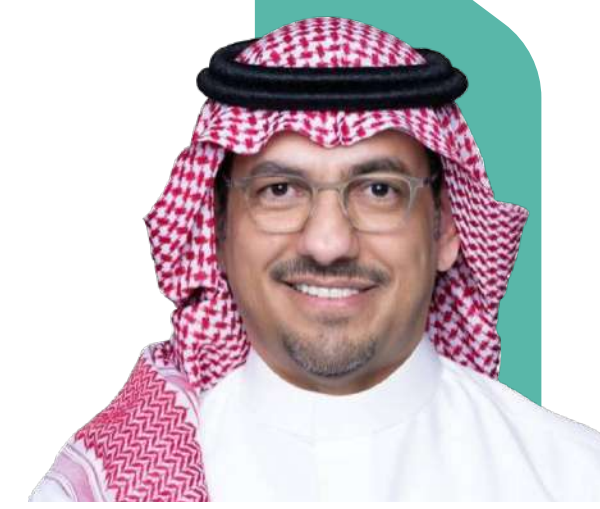
الأمير وليد بن ناصر آل سعود