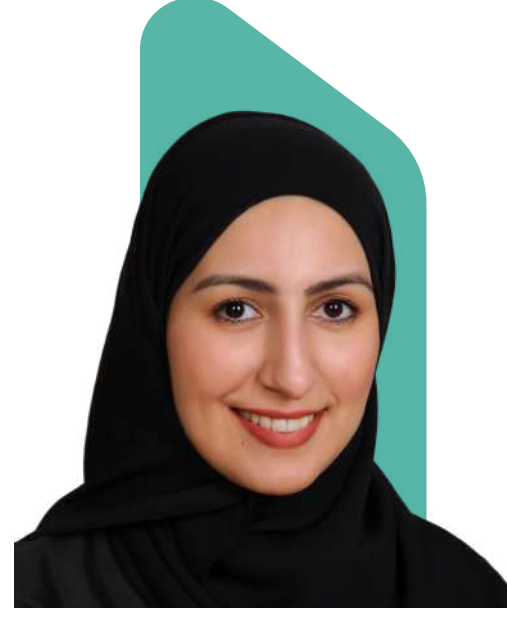
حنان منصور أهلي

مدير المركز الاتحادي للتنافسة والإحصاء في الإمارات العربية المتحدة