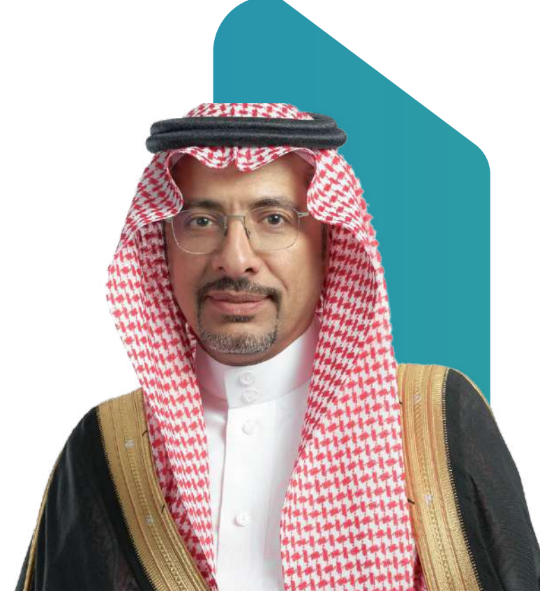
معالي وزير الصناعة والثروة المعدنية بندر بن إبراهيم الخريف