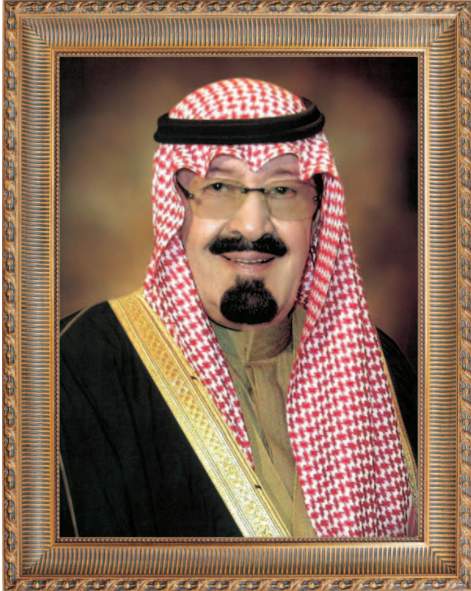
خادم الحرمين الشريفين الملك عبدالله بن عبدالعزيز آل سعود