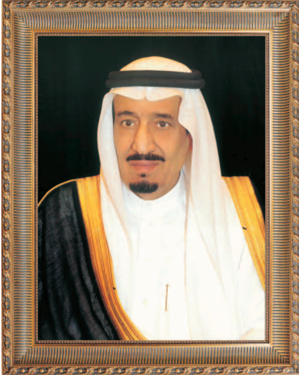
صاحب السمو الملكي الأمير سلمان بن عبدالعزيز آل سعود ولي العهد نائب رئيس مجلس الوزراء وزير الدفاع