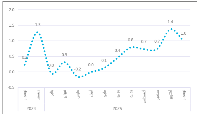
شكل 2. السلسلة الزمنية للأرقام القياسية لأسعار المنتجين حسب الأبواب الرئيسة، لشهر (نوفمبر 2025م) (%)