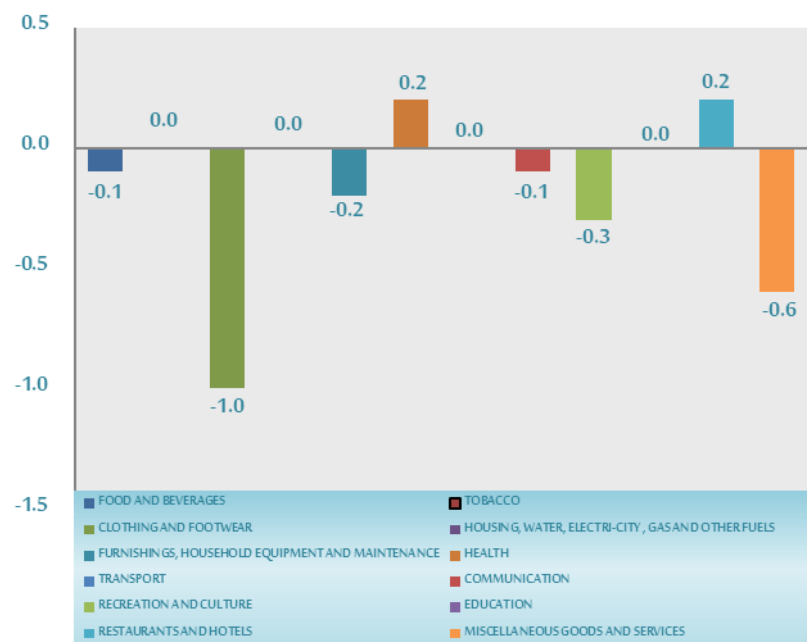
monthly relative changes of main sections during the month of Dec2017 compared to Nov2017