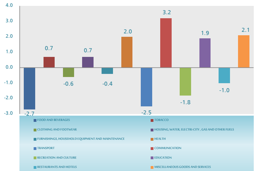
Annual changes relative to the main sections through Mar2017 compared to Mar2016