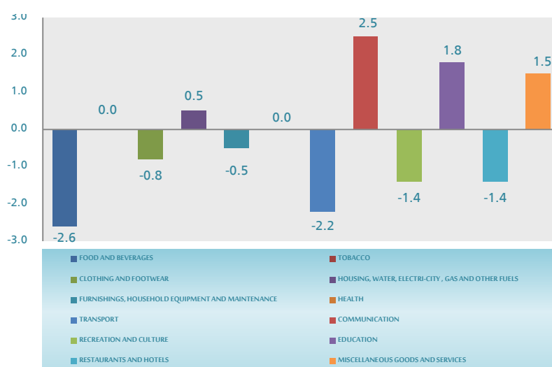
Annual changes relative to the main sections through Apr2017 compared to Apr2016